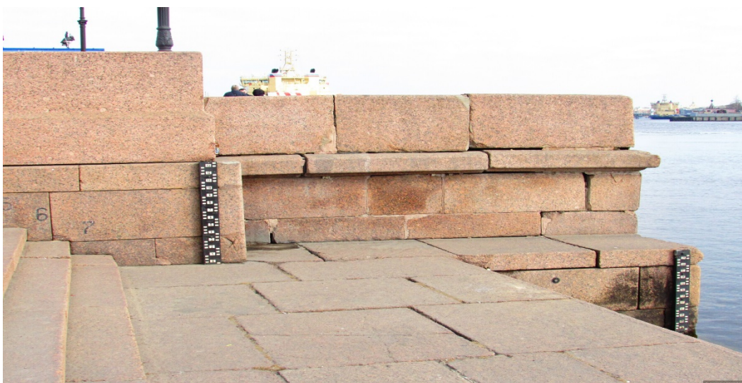
Футшток у Горного института.

Санкт-Петербург, расположенный в дельте Невы, за триста лет своего существования пережил 323 наводнения, которыми принято считать подъем воды на 1,6 м выше ординара (футштока), установленного в районе Горного института.